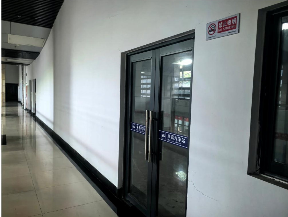
5号标的：米易汽车站二层（汽车站配套综合服务室〈1〉）