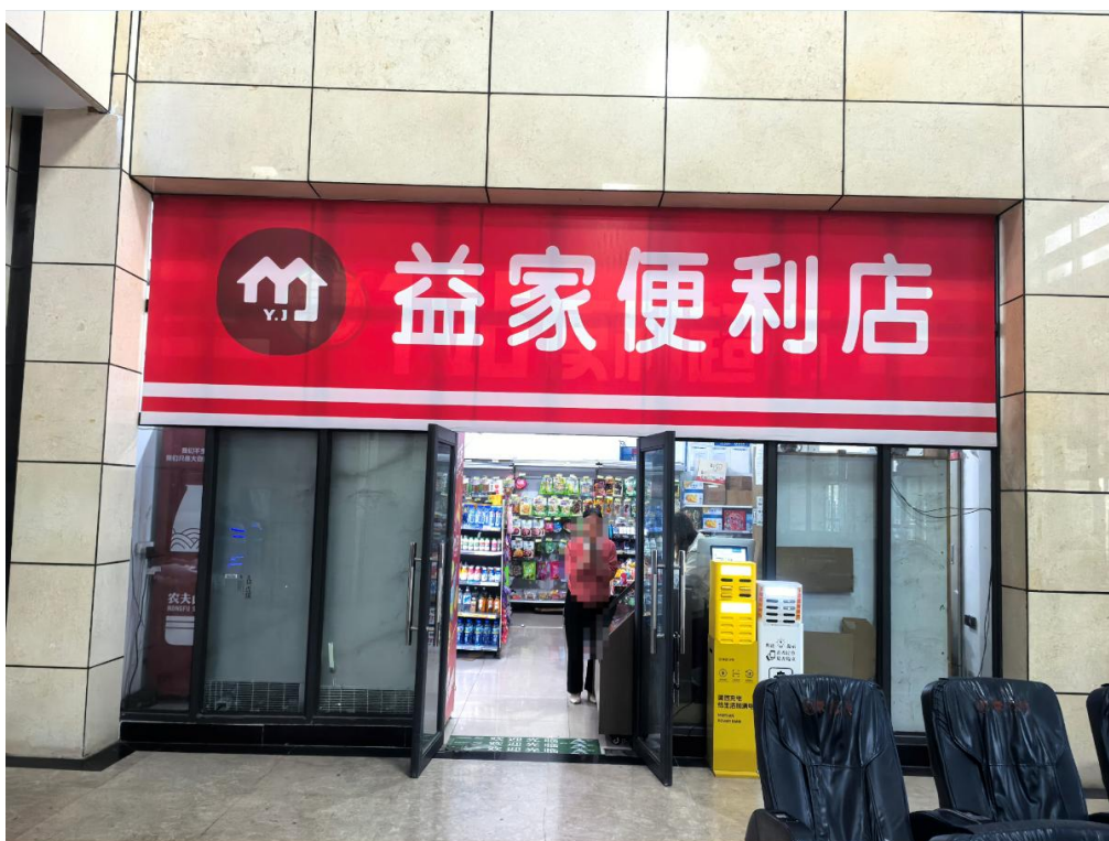
3号标的：米易汽车站一层（候车大厅综合服务室）