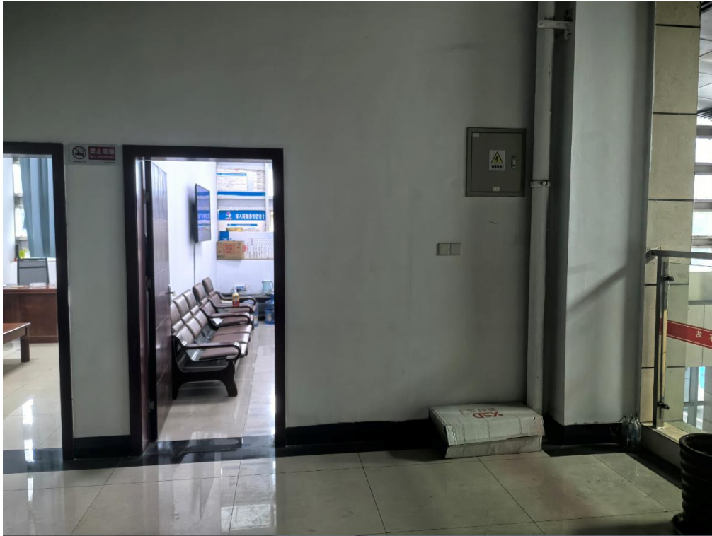
4号标的：米易汽车站二层（驾乘休息室）