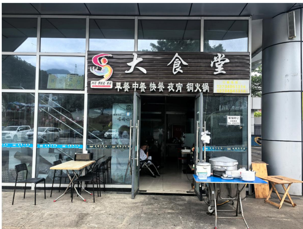
1 号标的：米易汽车站一层（汽车站配套快餐厅）