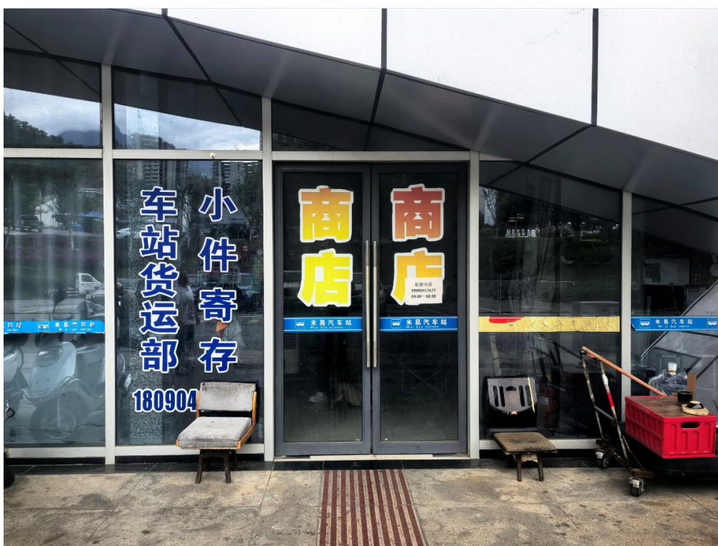
2号标的：米易汽车站一层（汽车站配套特色小卖）