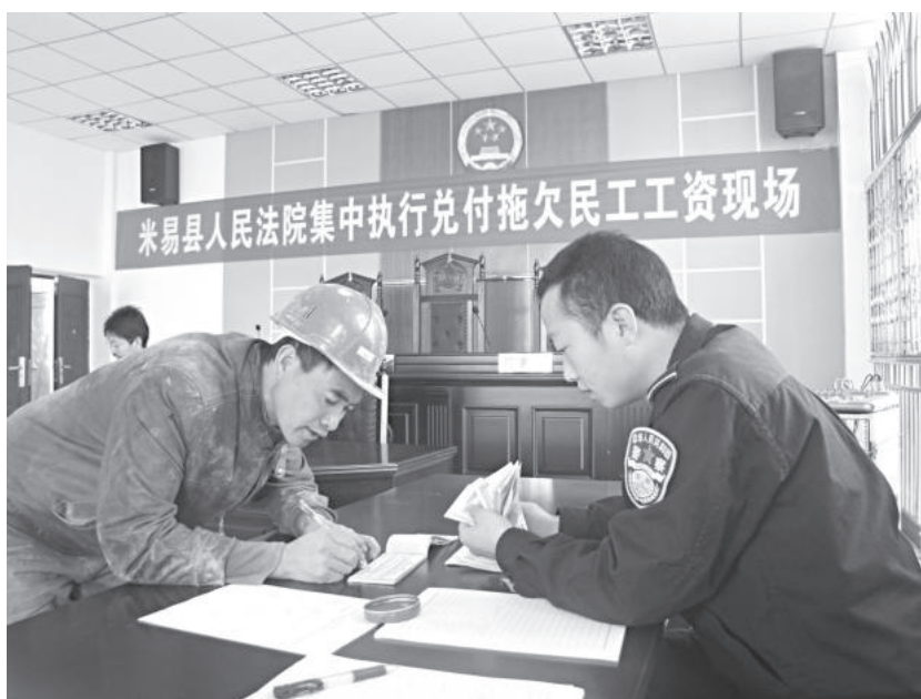
米易县人民法院集中执行兑付拖欠农民工工资现场

【服务保障经济发展】 依法办理时光水街项目设计合同纠纷案，金杯半山项目相关租赁、买卖合同纠纷案等一批群众关心、社会关注的涉重大项目案件，确保经济发展健康有序。依法审结