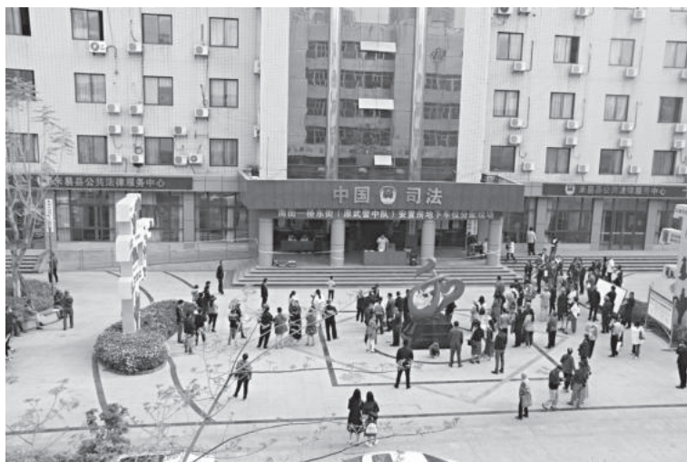
3月20日，米易县开展攀莲镇南街一桥东街地下车位分配工作

【民生工程】 有序推进2020—2021年9个区域的老旧小区改造，既有建筑增设电梯2部。完成13户公租房轮候对象房屋分配工作，49户经