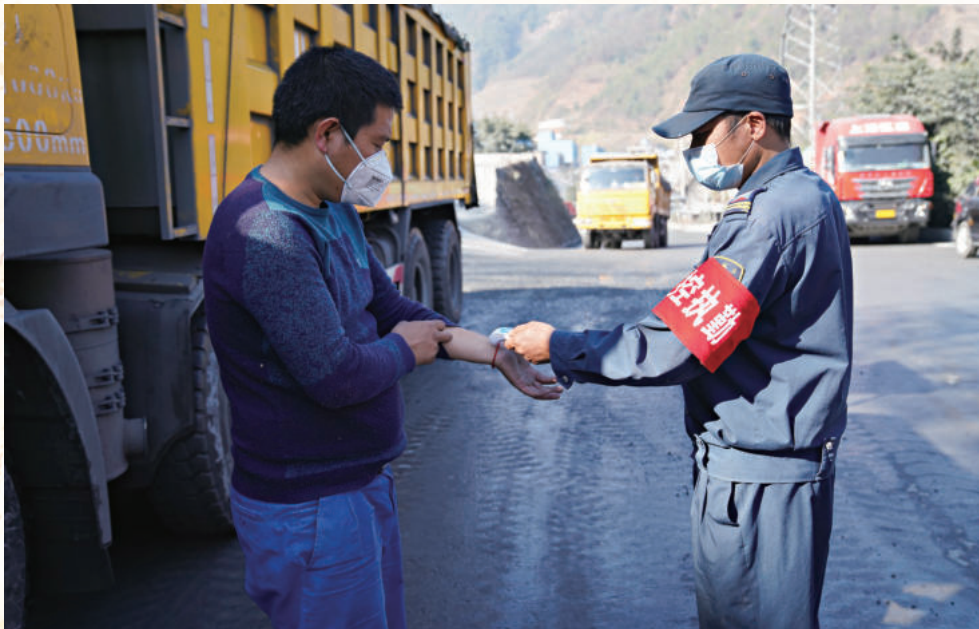
◀严防疫情，扎实生产