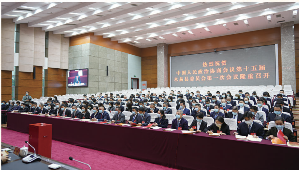
▲ 2021年12月5日召开的中国人民政治协商会议第十五届米易县委员会第一次会议