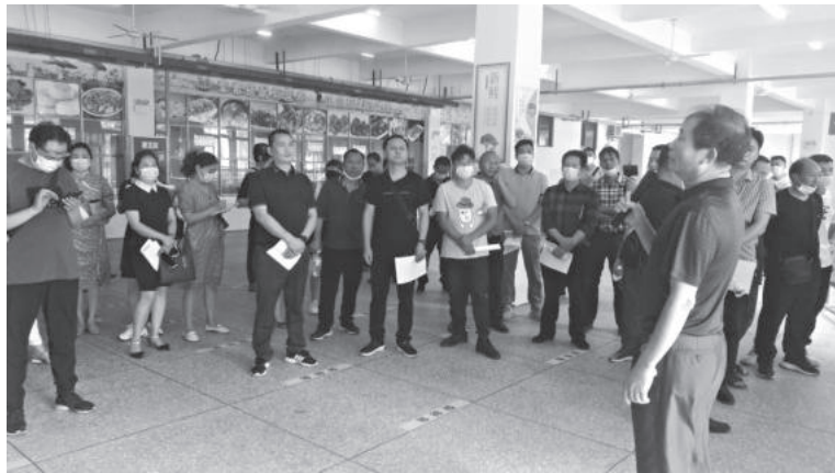
4月28日，米易县教育和体育局组织全系统开展学校安全暨森林草原防火拉练活动

认真贯彻教育方针，以抓管理、重教研、提质量为抓手，多措并举狠抓教育教学质量。结合攀枝花市义务教育教学质量监测综合评价方案，继续实施《米易县义务教育教学质量监测综合评价方案》，从“集中度、合格度、均衡度、优质度、目标度”五个维度进行评价。每学期定期召开全县教学工作会，做好全县的教学质量成绩分析；加大课改力度，继续研制米易县中小学基于