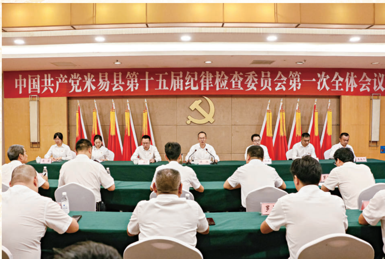
▲ 2021年9月14日召开的中共米易县十五届纪委第一次全会