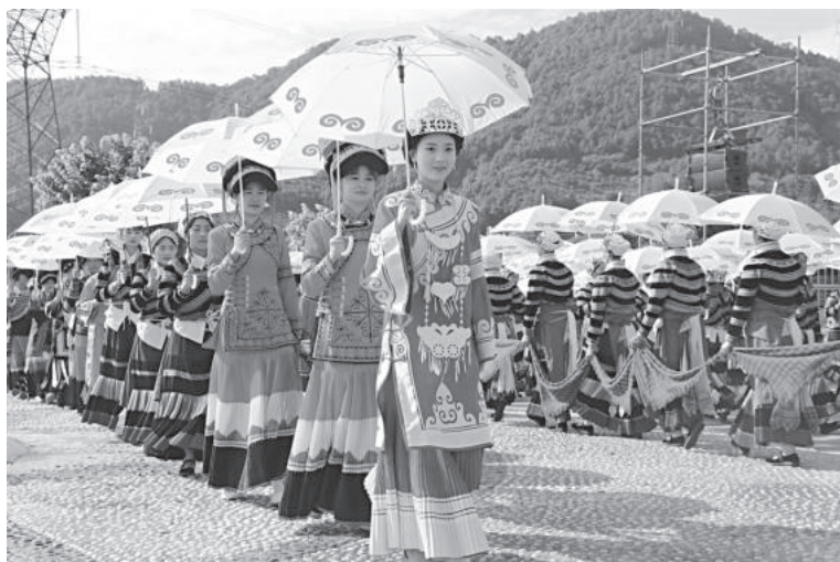
7月24日，麻陇乡举办“民族团结促振兴，感恩火把献给党”活动

【乡村振兴】 针对全乡 458 户建档立卡贫困和 22 户边缘不稳定户制定“一户一方案”从引导生活习惯上着手，从解决人员上户问题下功夫，从帮助产业、就业增收上想办法，切实确保脱真贫、真脱贫、不返贫。抓好“监测点”，建立动态监管预警机制。麻陇彝族乡坚持未雨绸缪，树立底线思维，用行动和实践探索防贫新路径，对 458 户贫困户、2021 年人均纯收入低于 6000 元农户和 22 户边缘不稳定户实行动态监管，逐户制定帮扶措施，每月关注其产业、就业、两不愁三保障及饮水安全情况，每月组织村“两委”干部、第一书记、驻村帮扶干部等人员召开专题会进行会商，提出预判意见，提前响应、因户施策、及时补短，确保稳定实现“两不愁三保障”，不发生致贫返贫现象。基础设施和公共服务水平持续改善。巩固拓展脱贫攻坚成果同乡村振兴相衔接的专项资金 222 万元，全部用于改善农业生产条件和发展产业支出。农业产业结构不断优化。持续擦亮农业品牌，着力在提质增效上求突破，坚持推进“一村一品”，各村产业各具特色，重点打造