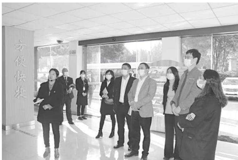
12月9日，米易县镇村便民服务体系“三化”建设试点工作接受省级检查验收

其中线上办理 36299 件，线下办理 205479 件，乡镇办理 20902 件。办件覆盖率 99.61%，全县主动评价数 236661，主动评价率 96.10%。