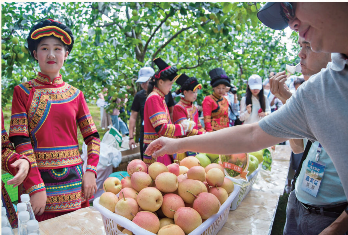
▲产销两旺的特色水果