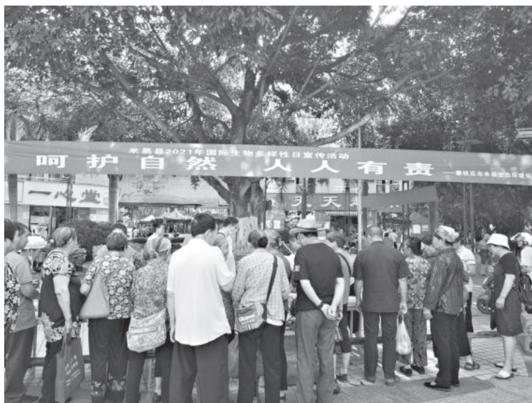
5月23日，米易县环委办牵头组织在攀莲镇城北天天超市门口开展国际生物多样性日宣传活动

【环保宣传】 强化各类媒体宣传，通过广播、电视、微信、抖音等平台发布生态文明建设、污染防治、绿色低碳等生态环境保护信息 230 余条，大力宣传习近平生态文明思想和