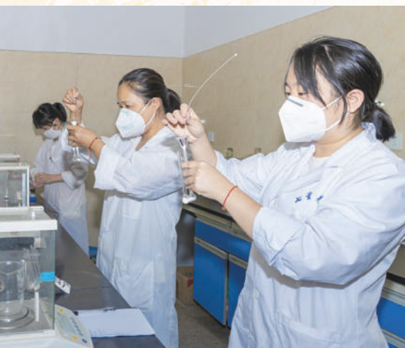
▲ 精心操作，确保工业产品质量关