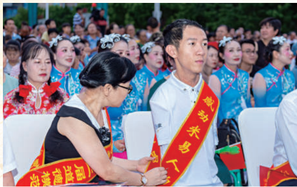
▲ (石磊 摄)