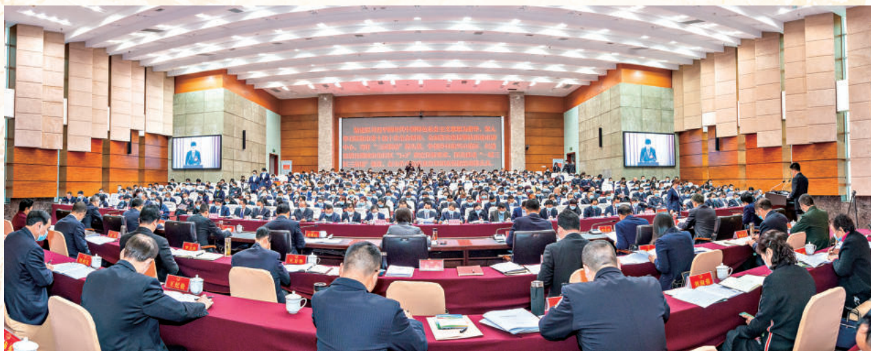
▲ 2021年1月30日召开的米易县第十八届人民代表大会第六次会议