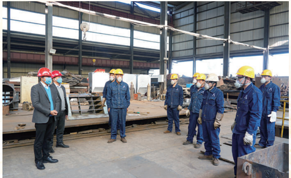
疫情要防控，安全抓生产▶