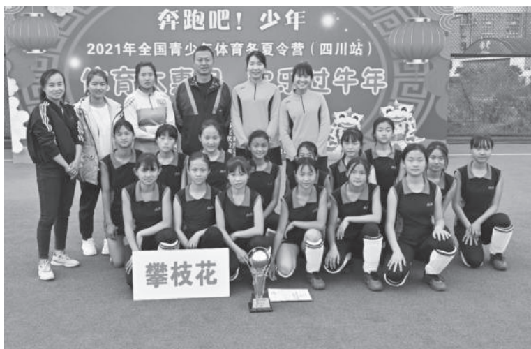
2月22日，四川省米易中学校女子曲棍球队获得2021年全国青少年体育冬夏令营（四川站）暨四川省青少年曲棍球冠军杯决赛第三名

届全运会赛艇、皮划艇项目比赛28年后，再次承办全运会外放项目比赛，也是米易县建县以来首次承办全运会单项比赛。