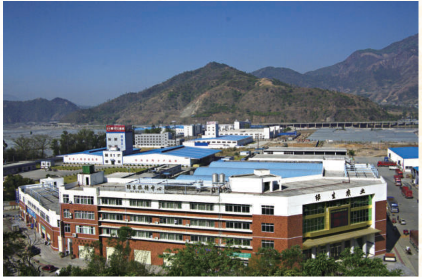
攀西现代特色农业产业园区一角 ▶