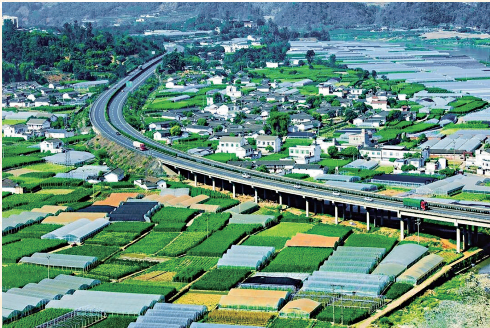
▲米易县现代农业产业基地一角