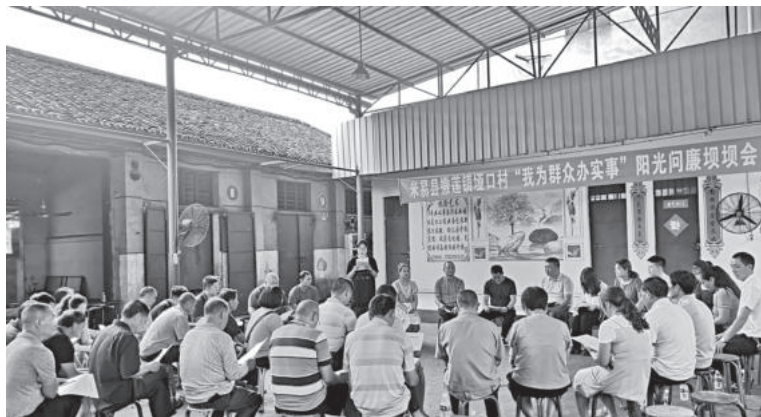
撒莲镇垭口村“我为群众办实事”阳光问廉坝坝会

【生态文明建设】 坚决守住绿水青山，扎实开展中央和省级环保督察及“回头看”反馈问题