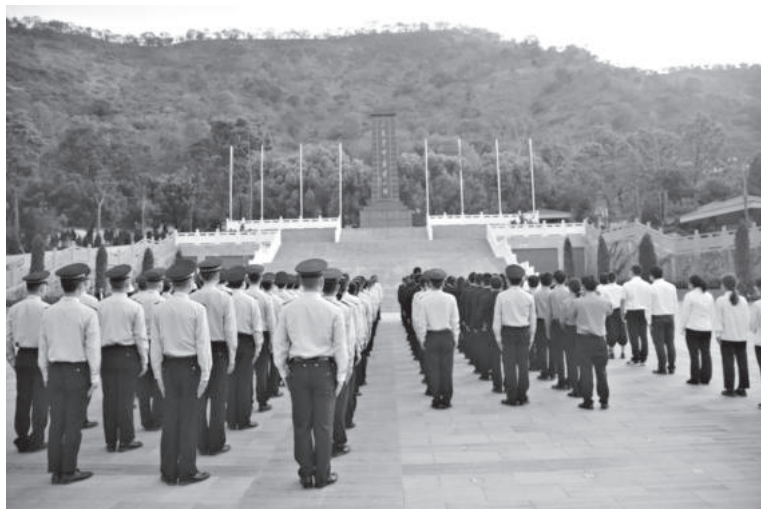
3月18日，米易县组织政法部门干警 200 余人到米易县烈士陵园举行公祭烈士暨政法队伍教育整顿英模教育活动，追寻革命足迹，传承红色基因，缅怀革命先烈，让学习教育入脑入心

【执法监督】 开展“万案大评查”工作，制定米易县案件评查工作方案，对案件交叉评查反馈的问题进行全面集中整改，健全完善相关制度机制，切实规范执法司法行为。米易县今年被评查的 58 件案件中，合格案件 52 件，瑕疵案件 4 件，不合格案件 2 件。集中开展执法司法规范化专项治理工作。成立米易县政法部门执法司法规范化专项治理领导小组，下设办公室在县委政法委，具体统筹政法各部门，开展为期 3 个月的执法司法规范化专项治理工作。做好国家司法救助工作，2021 年米易县实际使用国家司法救助资金 27.69 万元，涉及案件 8 件，涉及人数 11 人，最大限度地维护了社会稳定。落实政法系统相关工作制度，结合政法队伍教育整顿，组织政法各部门召开米易县刑事案件联席会议 3 次、政法系统培训例会 3 次、政法干警旁听庭审会 4 次，为政法工作有序有效开展提供了强有力的制度保障。做好涉法涉诉信访接待工作，接访群众案件 16 件 22 人次。推动涉法涉诉信访积案攻坚化解，完成上级下达的 3 件涉法涉诉“治重化积”任务，自行排查的 6 件涉法涉诉信访案件均妥善化解。加大涉法涉诉信访线索案件督办力度，对市教育整