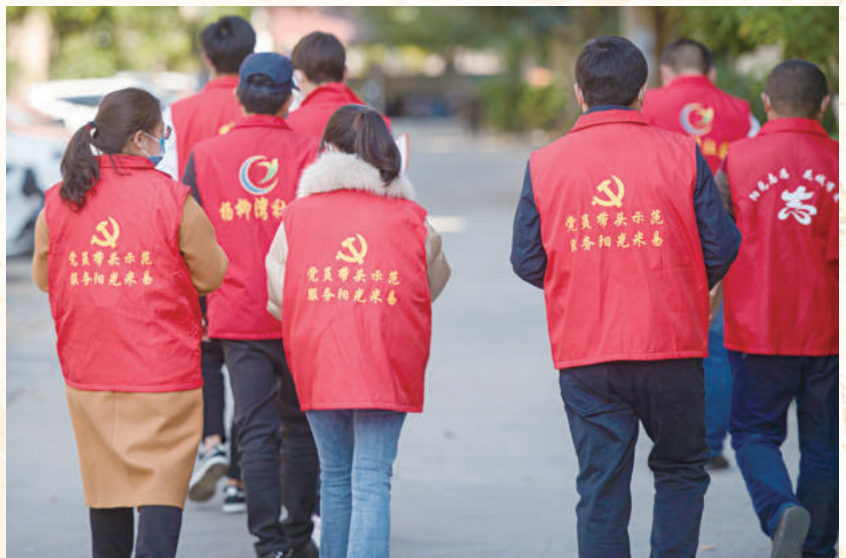
▶ 阳光志愿，服务社会