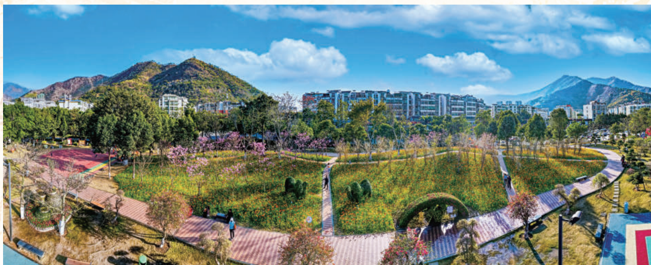
▲公园城市，活力无限