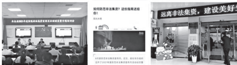
6月，米易县财政局积极组织开展防范非法集资宣传月活动

务居家养老服务试点，探索以村居委会作为政府购买服务承接主体培育试点，推动乡镇政府购买服务改革取得明显突破，为全面推开乡镇政府购买服务提供经验。