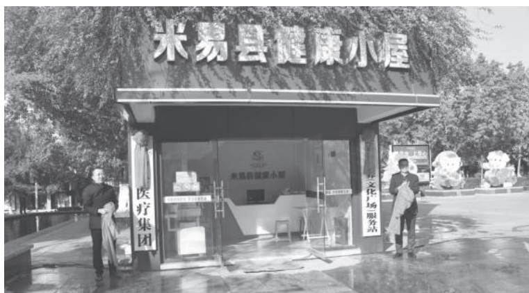
1 月 28 日米易县医疗集团与攀枝花市长果智慧康养科技有限公司在县文化广场举行“康养服务站”揭牌仪式

医共体建设试点工作，基本建成覆盖县、乡、村三级的整合型服务体系，完善“三张清单”（权责清单、责任清单、评价指标体系清单），实施药品耗材统一采购管理、人事薪酬制度改革，组建医学影像等“六大中心”，医共体内部实行信息化、财务管理、药械招采、质量控制、用药目录等五个统一。与省妇幼保健院合作，省妇幼保健院·省妇女儿童医院首家分院落地米易，并联合开展儿童先心病免费筛查工作，免费筛查 2.41 万人，完成 16 名患儿的免费手术治疗。