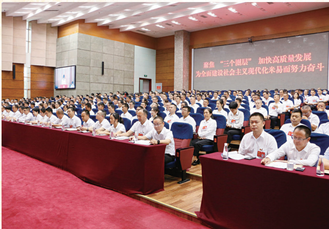
▲ 2021年9月14日召开的中共米易县第十五次代表大会