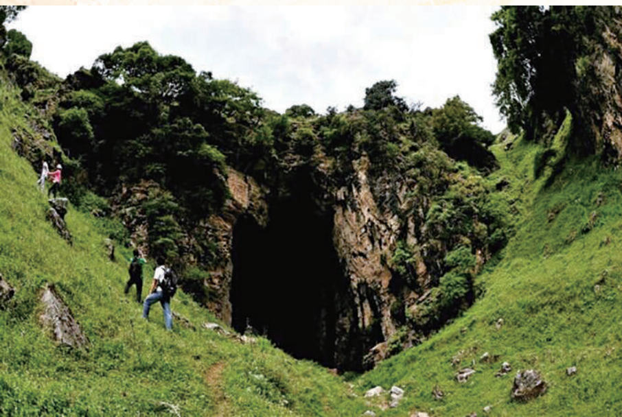
◀高山草甸中的马鹿寨蛮王洞，让各地游客纷至沓来