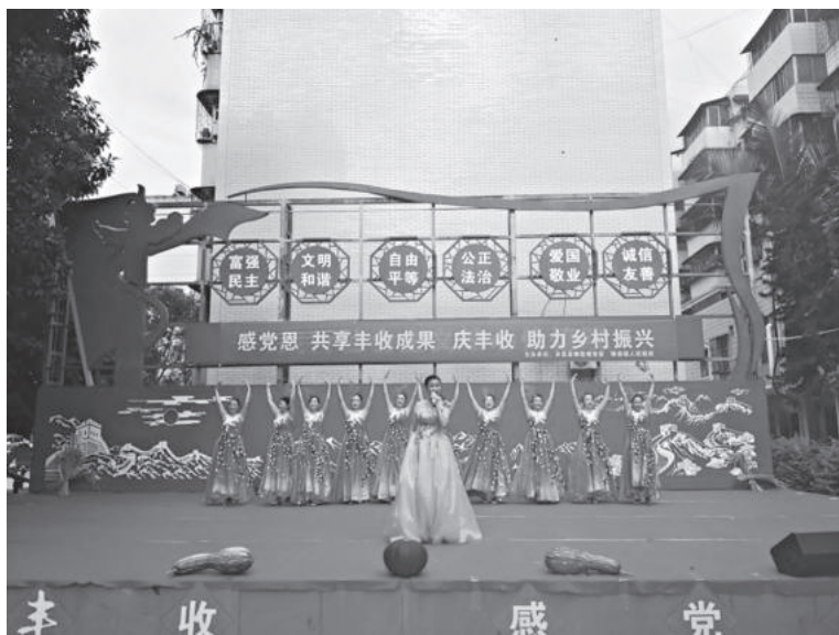
9月23日，攀莲镇举办了以“感党恩共享丰收成果，庆丰收助力乡村振兴”为主题的系列庆祝活动

【综治维稳】 调处各类民间纠纷 138 件，调处成功 126 件，及时办理群众信访 451 件，按时办结中央和省交办的重信治理 2 件。防邪禁毒扎实推进，按时转化邪教人员 50 人，组织干部群众 3100 余人次参与禁毒防毒走访排查工作，排查人