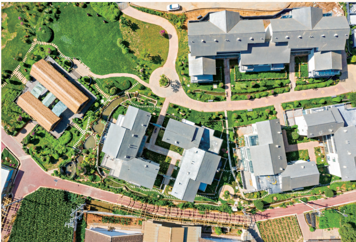
▲ 撒莲镇鲜花里特色康养民俗村鸟瞰图