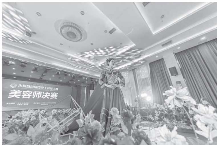
米易县首届农民工技能大赛美容师决赛现场

【社会保障】 城乡居民养老保险参保 9.58 万人、参保率 96% 以上；着力推动灵活就业人员、