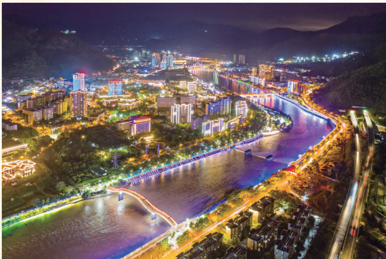
▲米易夜景，美不胜收