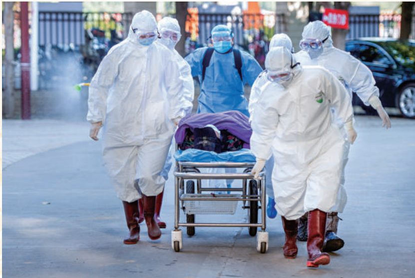
◀ 争分夺秒，生命至上