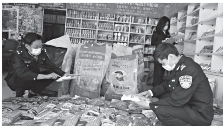
2月24日，米易县农业农村局在丙谷开展农资检查，保障春耕备耕工作

【环保与绿色农业】 持续深入推进农业绿色发展，实施生态调控、生物防治、科学用药在内的农作物有害生物绿色防控32.29万亩，绿色防控覆盖率达到48.98%，建立病虫害全程绿色防控示范片3个（玉米2.39万亩、枇杷2000亩、水稻550亩）；建设攀西农作物病虫害生物防治天敌繁育基地。加大农业面源污染治理力度，全年秸秆资源量10.44万吨，农膜使用量1936吨，分别