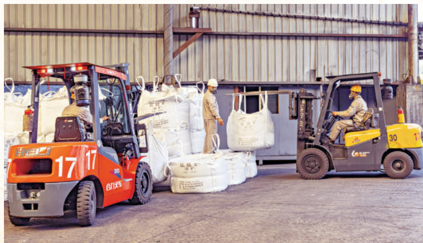
▲ 转运中的工业产品